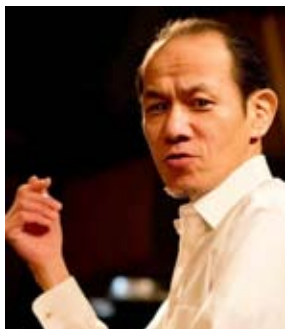
Gato Bar 店主